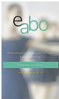
Die App entstand zusammen mit Partnern aus Deutschland. SCREENSHOT